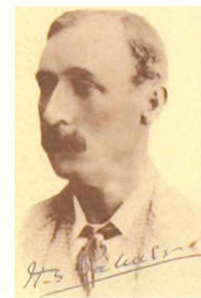
ヘンリー・スペンサー・パーマー 〔御坂サイフォン〕設計監督