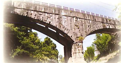
御坂サイフォン水路橋