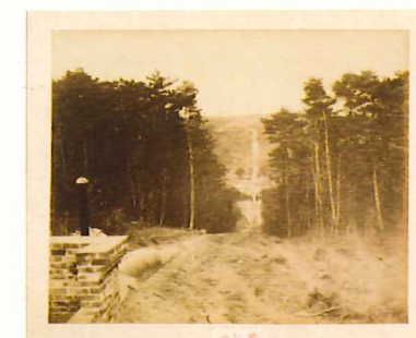
建設当時の御坂サイフォン (上流側から撮影)